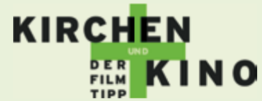
Grafik: Website Haus kirchlicher Dienste Hannover

Schließlich folgte dann im März der mehrmals verschobene französische Kinofilm über die Entstehung eines berühmten Pariser Bauwerkes,