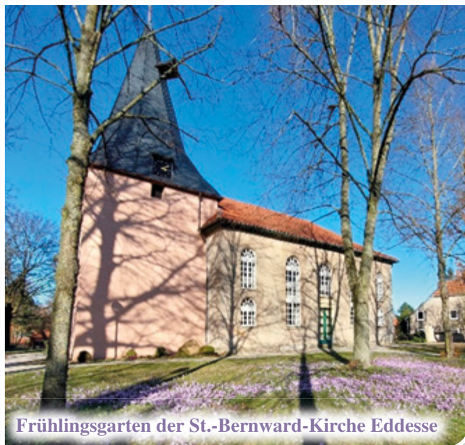
Frühlingsgarten der St.-Bernward-Kirche Eddesse