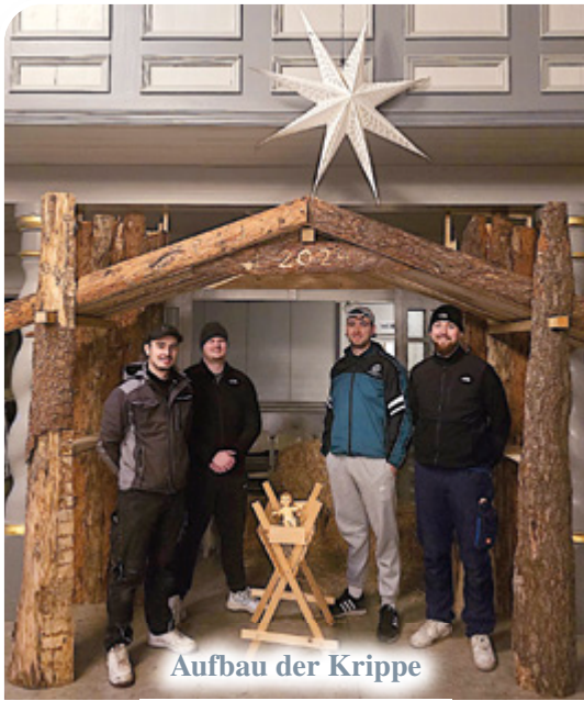
Aufbau der Krippe